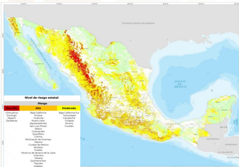
Mapa de riesgo del periodo Octubre-Diciembre 2023.